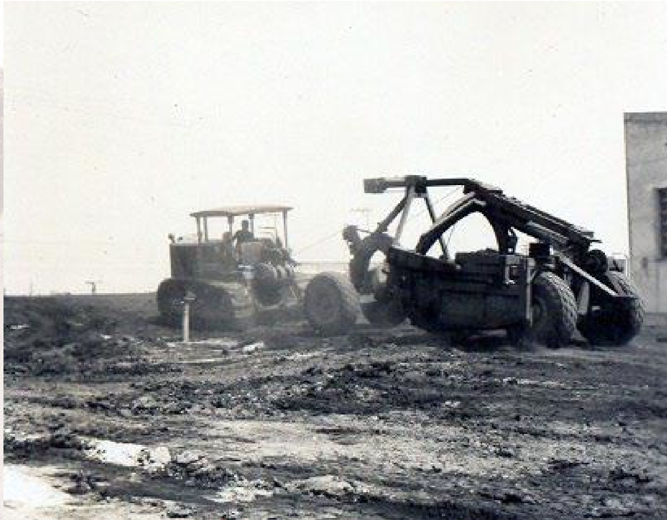
Terreno da Fábrica I, em Rudge Ramos. 1955

E a instalação da Termomecanica na região tem participação fundamental nesse destino.