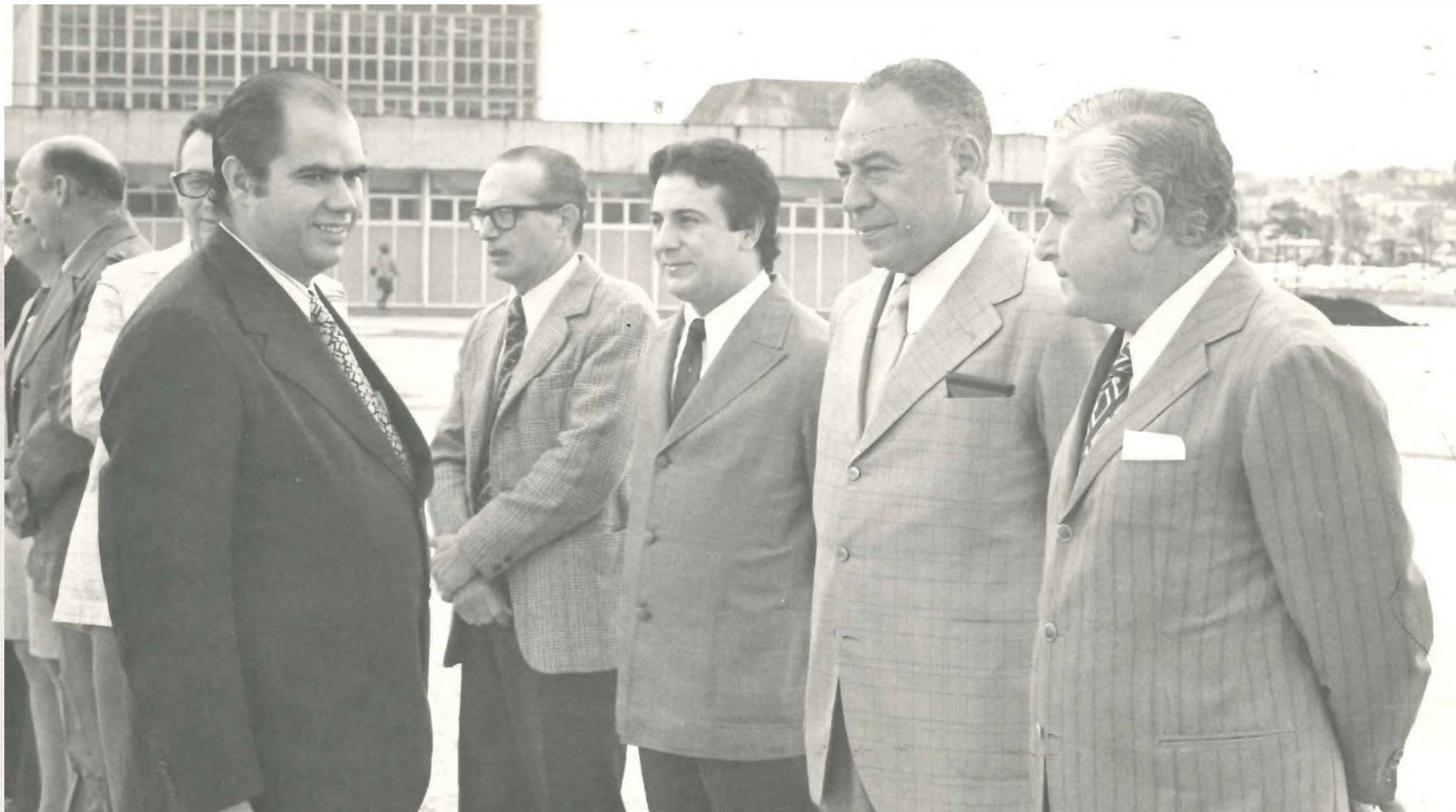
Cerimônia de entrega do mérito "Cidadão Sãobernardense". 1971