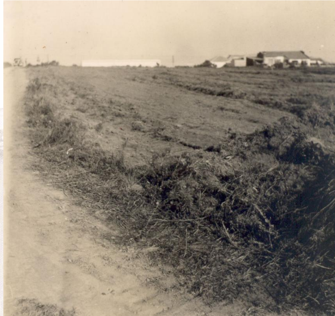
Terreno da Fábrica I, em Rudge Ramos. 1955

A paisagem era, então, composta quase apenas de chácaras e sítios.