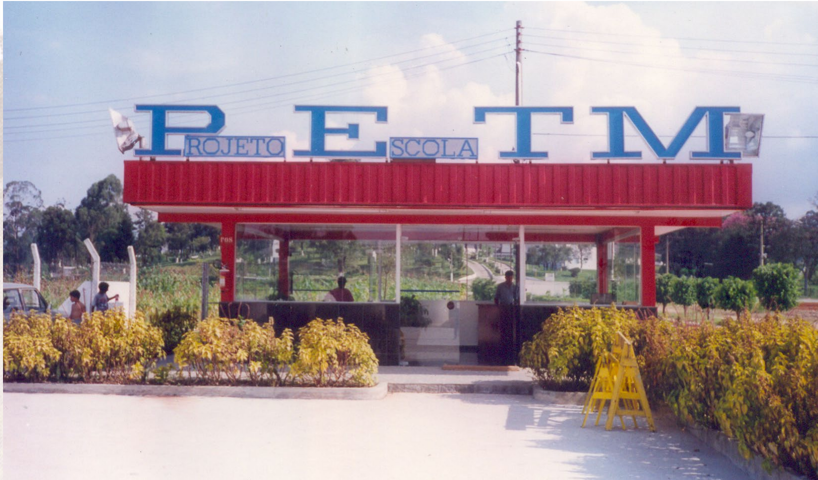
Portaria do Projeto-Escola TM. 1995

A fundação, em 1989, do Colégio Termomecanica, que hoje integra o Centro Educacional da Fundação Salvador Arena, tem beneficiado de diversas formas a comunidade local.