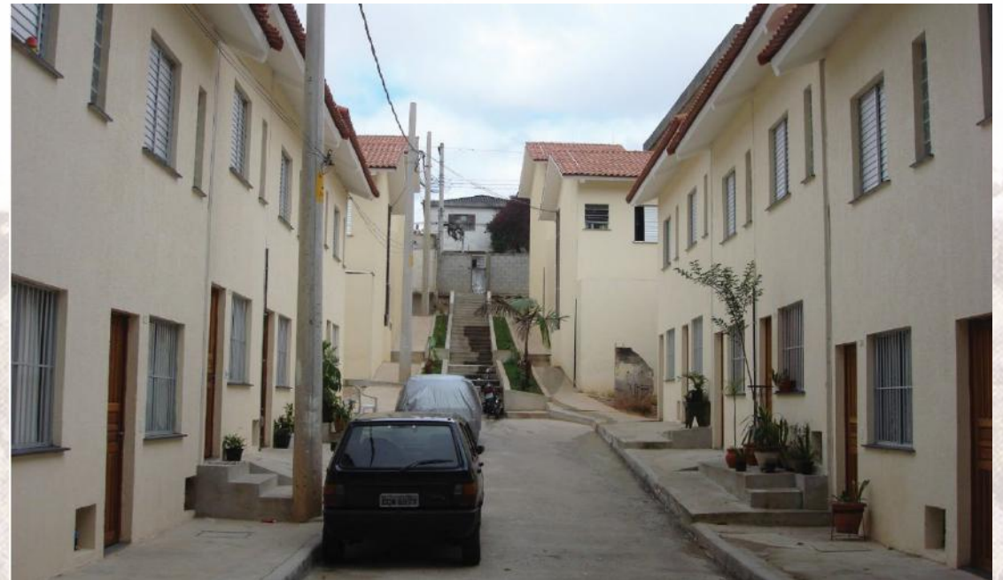
Projeto Habitacional Itatiba Final da década de 2000