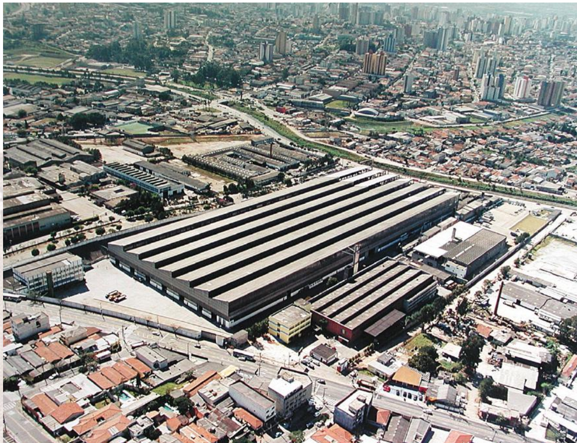
Termomecânica - Fábrica II. 2006

A Fundação Salvador Arena e São Bernardo do Campo continuam caminhando lado a lado, crescendo juntas.