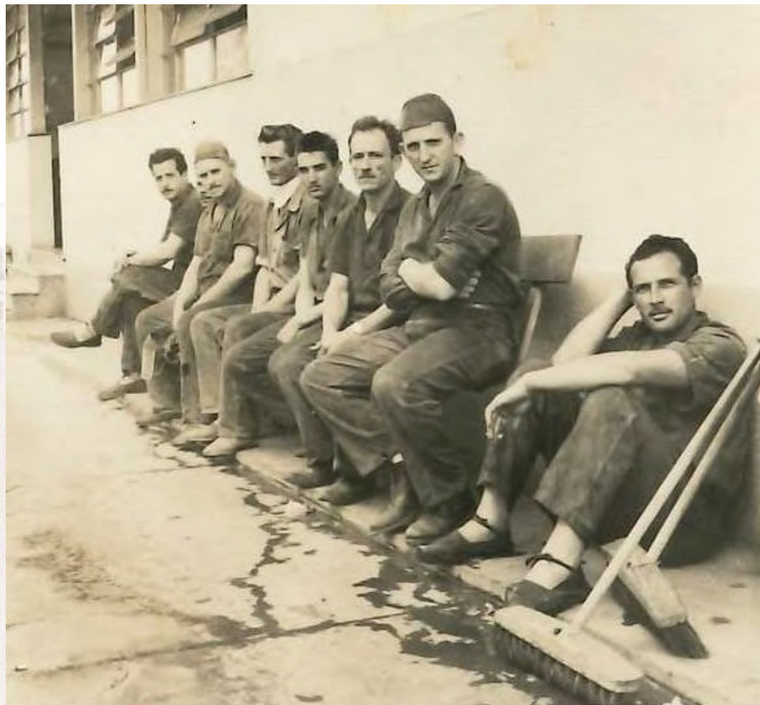
Construção da Fábrica I, em Rudge Ramos. 1955

Esta exposição tem o objetivo de divulgar um pouco dessa história em comum, que é formada, por sua vez, por tantas histórias de vidas.