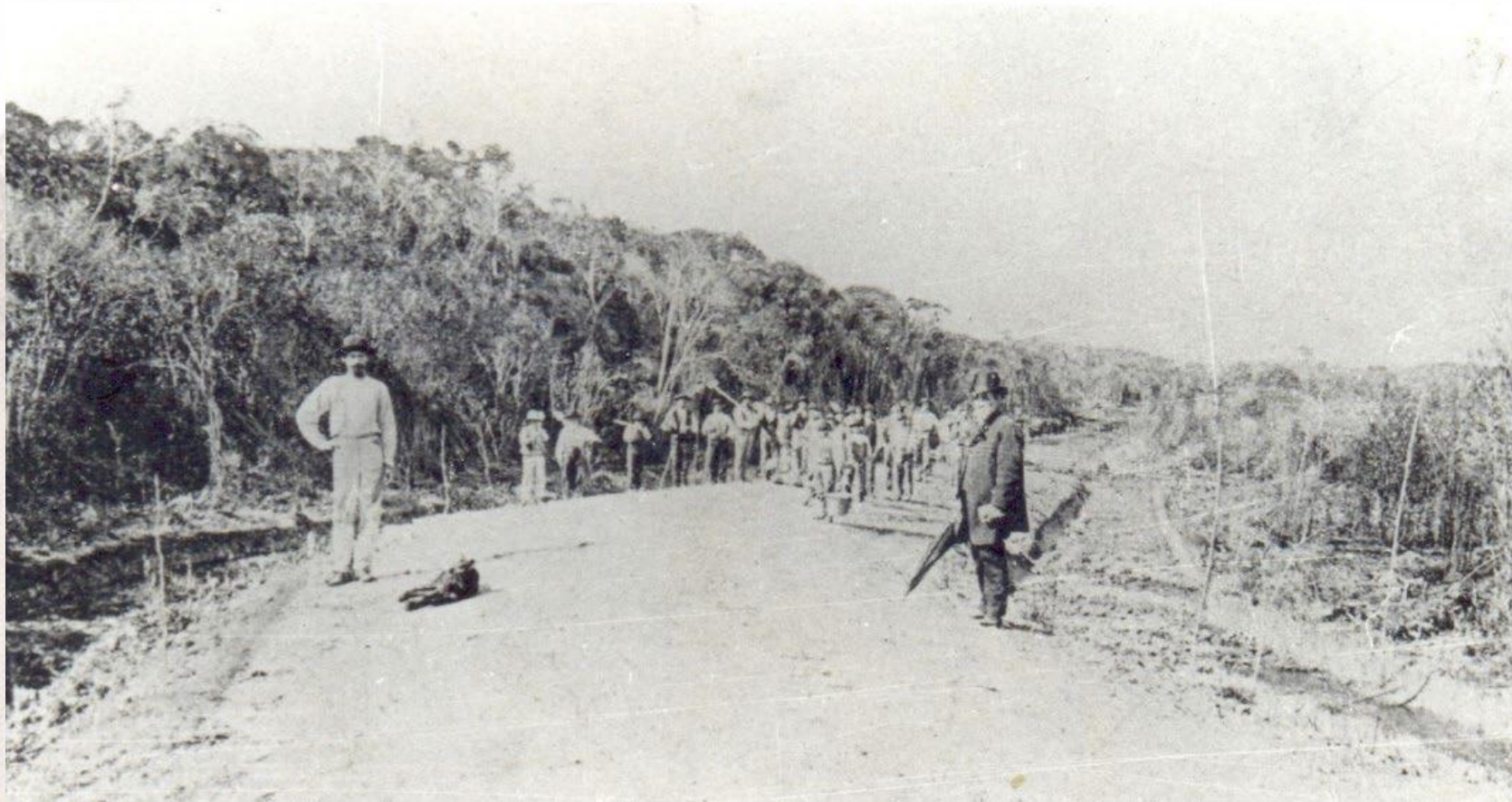
Avenida Pereira Barreto. 1895