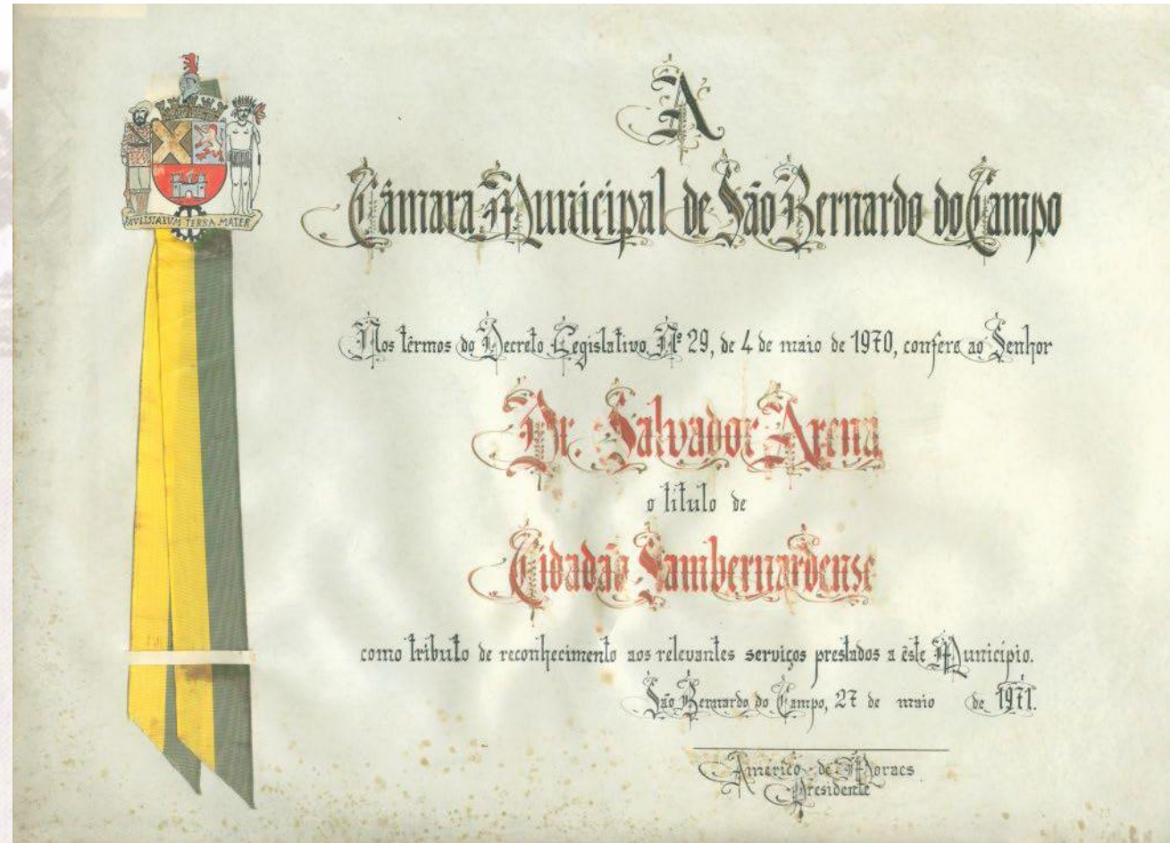
Título de Cidadão Sambernardense. 1971