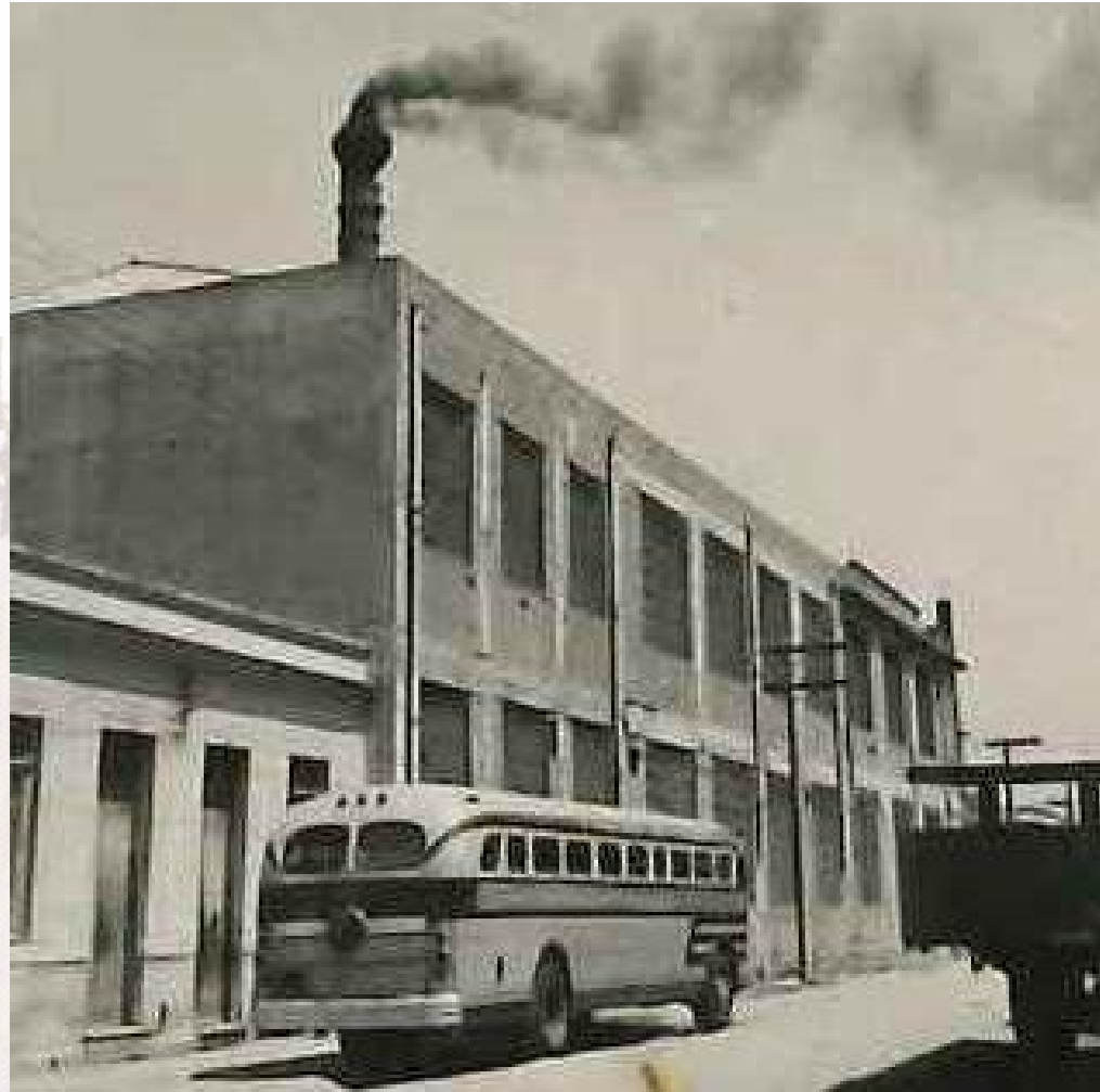
Termomecanica na Mooca. Década de 1950