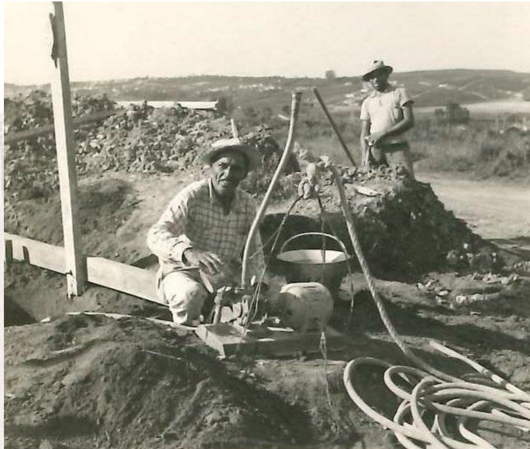
Construção da Fábrica I, em Rudge Ramos. 1955

A Fábrica ficava, então, inacessível se chovia, e era preciso buscar alimentos para os funcionários no Ipiranga de Jipe. O transporte era escasso, e a energia elétrica, inexistente.