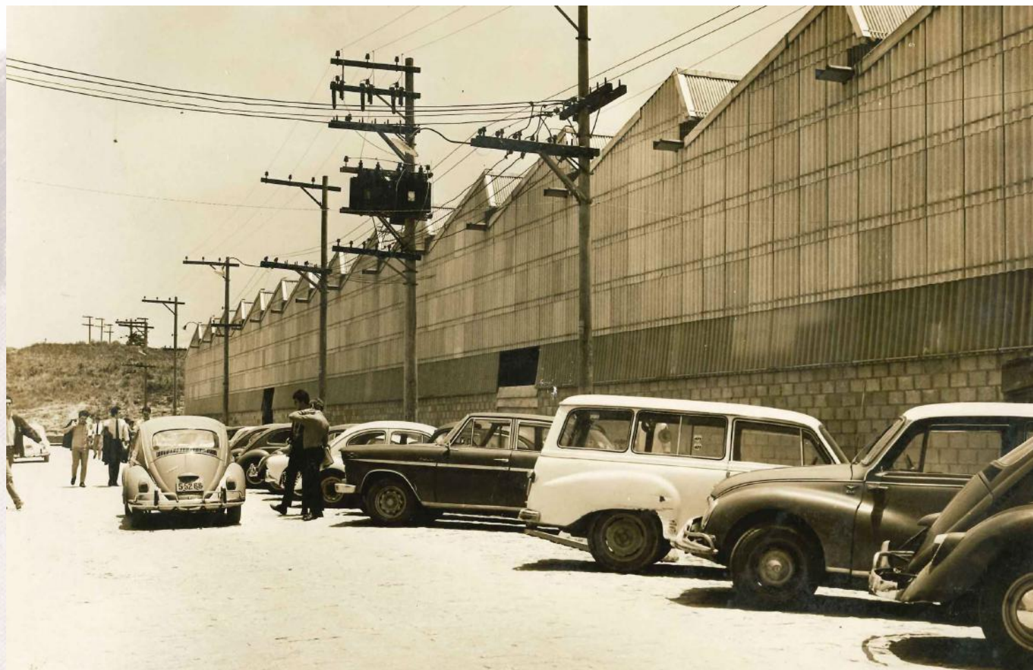
Pavilhão Termomecânica, na FEI. Década de 1970

E a criação da Fundação Salvador Arena, em 1964, formalizou e ampliou as ações sociais que já vinham sendo praticadas, principalmente na cidade.