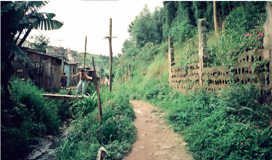
Projeto Habitacional Itatiba Início da década de 2000

E podemos dizer, sem medo de exagerar, que não foi só com a construção da Fábrica que a instituição modificou a paisagem da cidade.