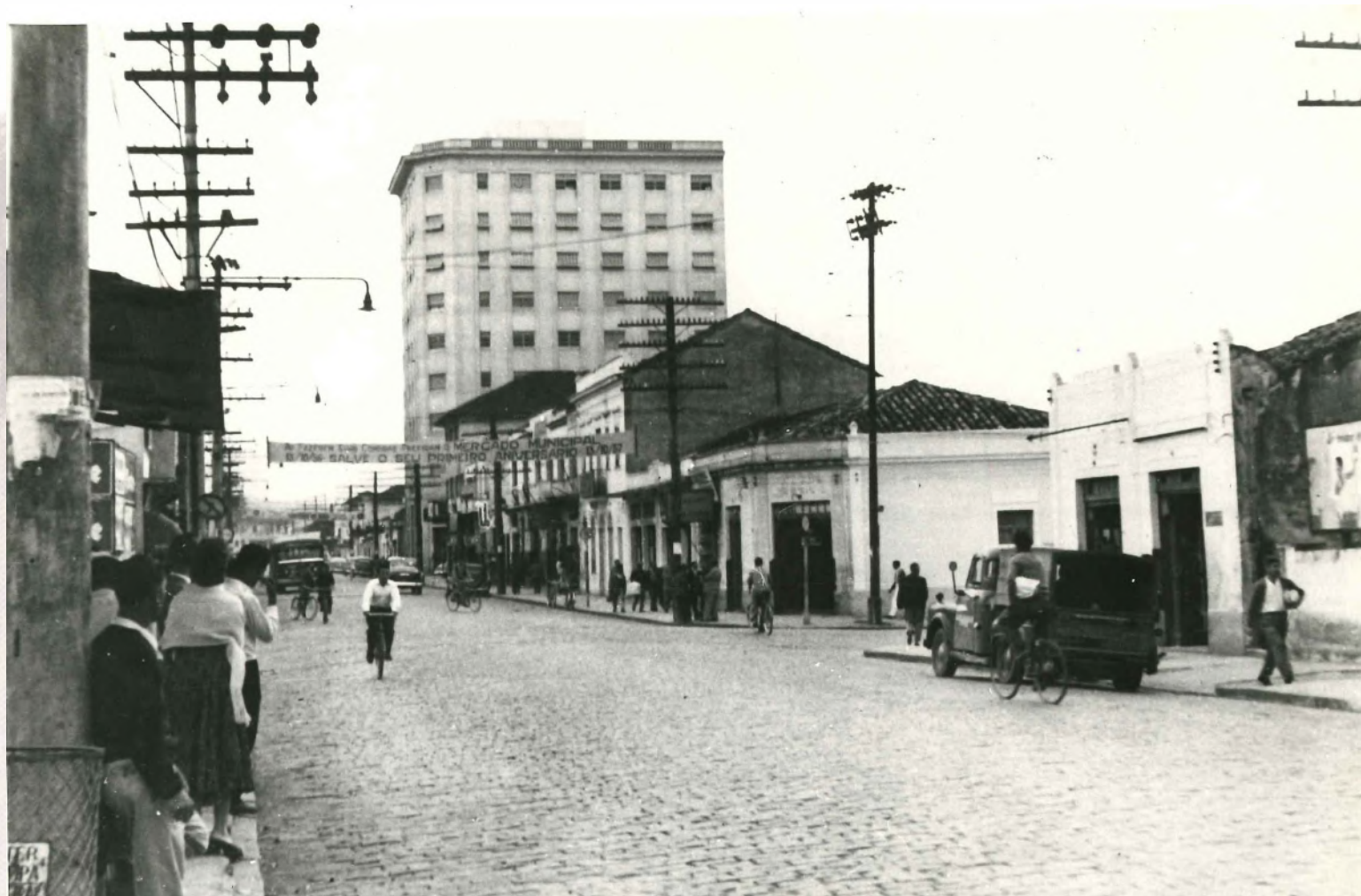
Avenida Jurubatuba. 1957

... mas foi o pontapé de uma história em comum que continua se perpetuando.