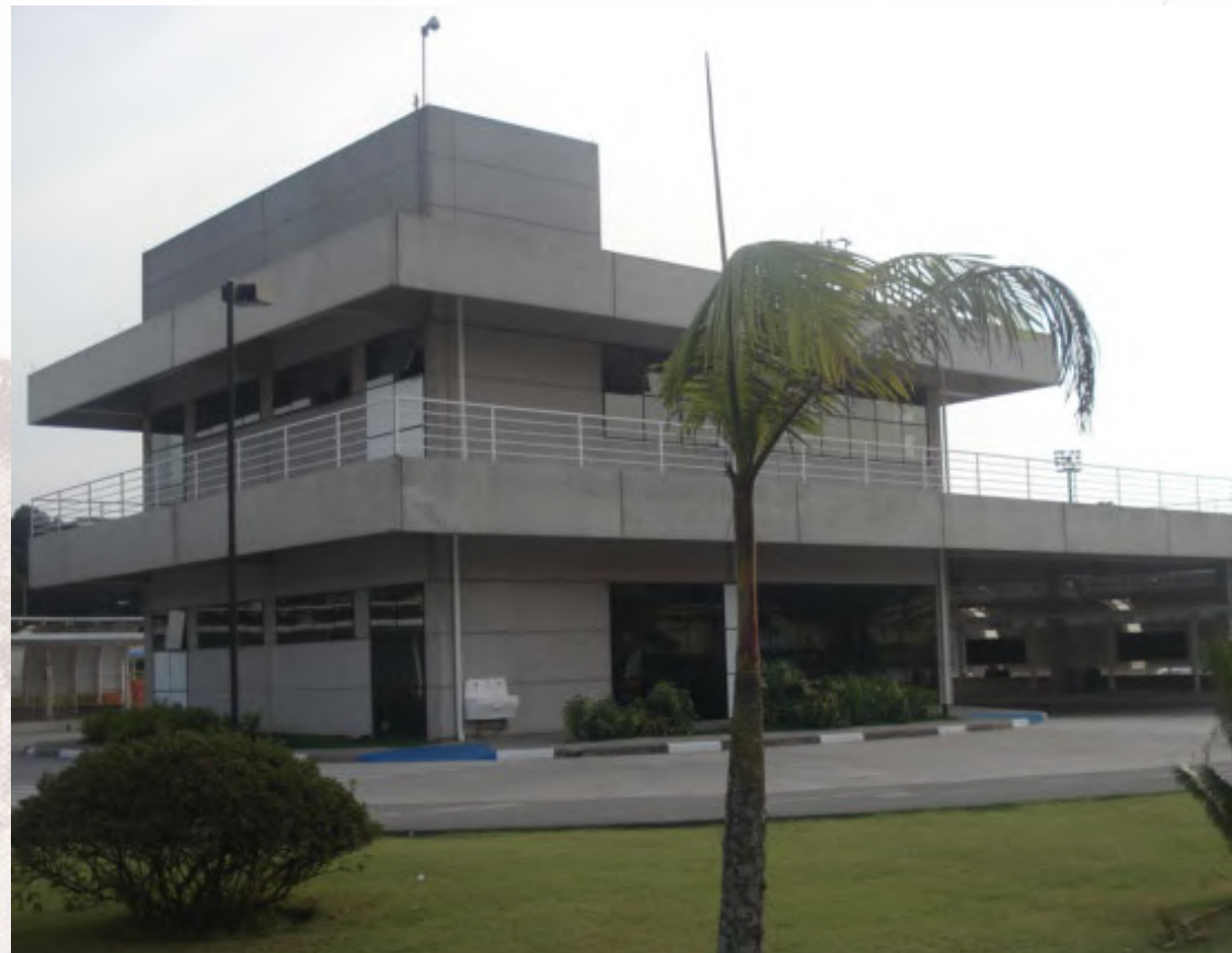
Portaria CEFSA. 2008