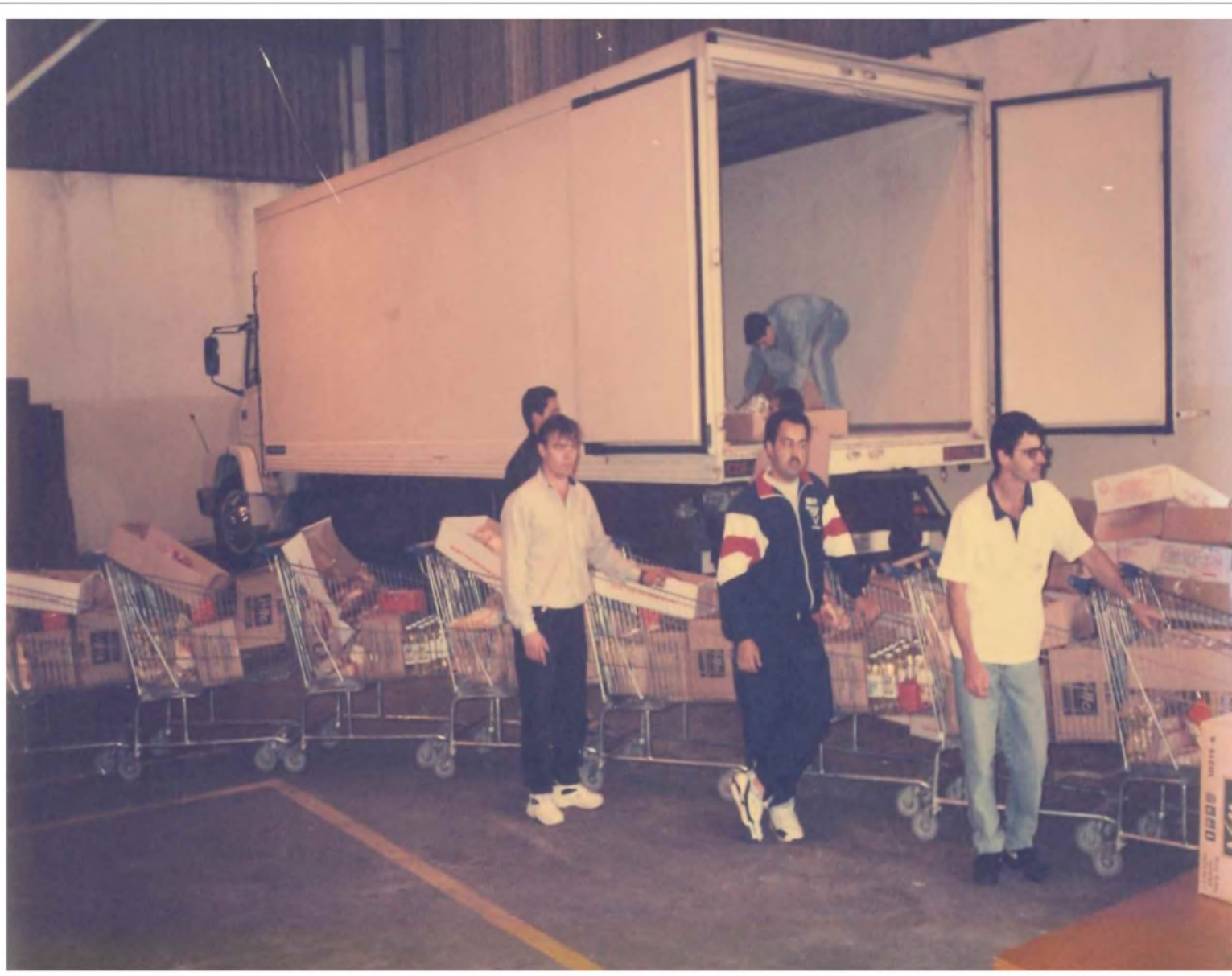
Programa “Adote um Desempregado”. Déc. 1990