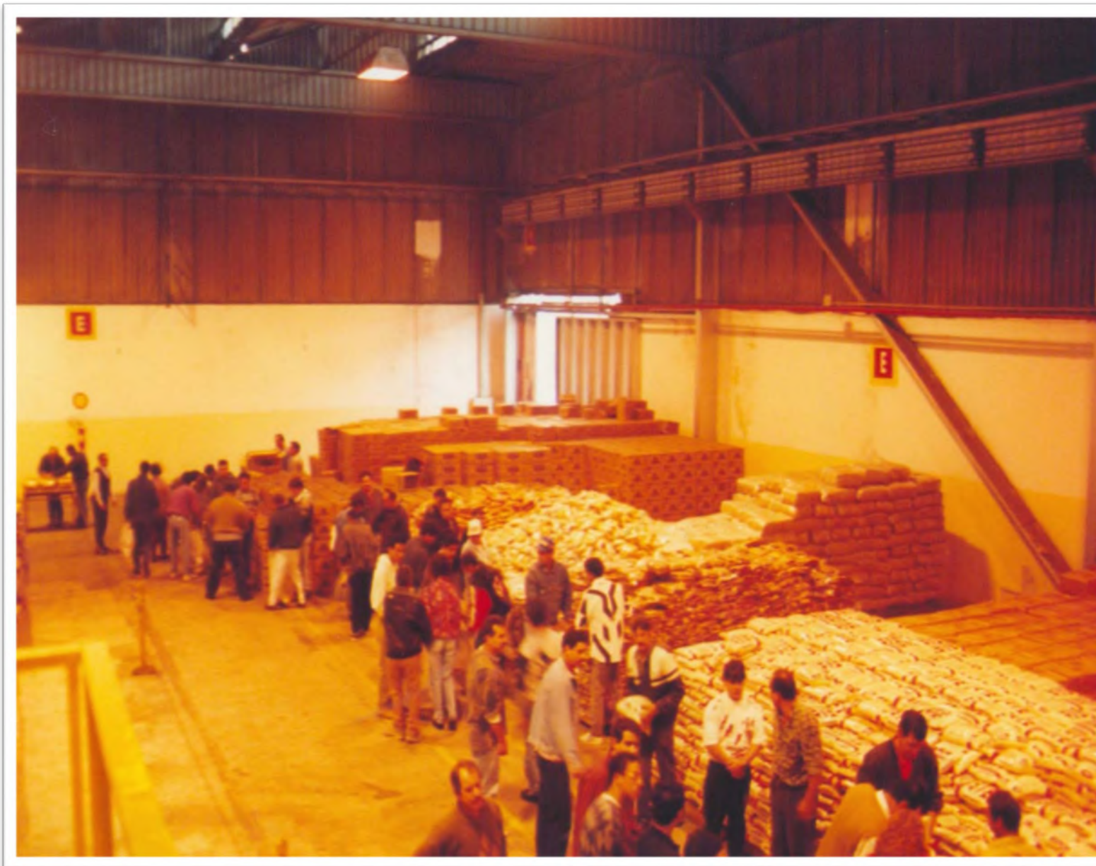
Programa “Adote um Desempregado”. Déc. 1990