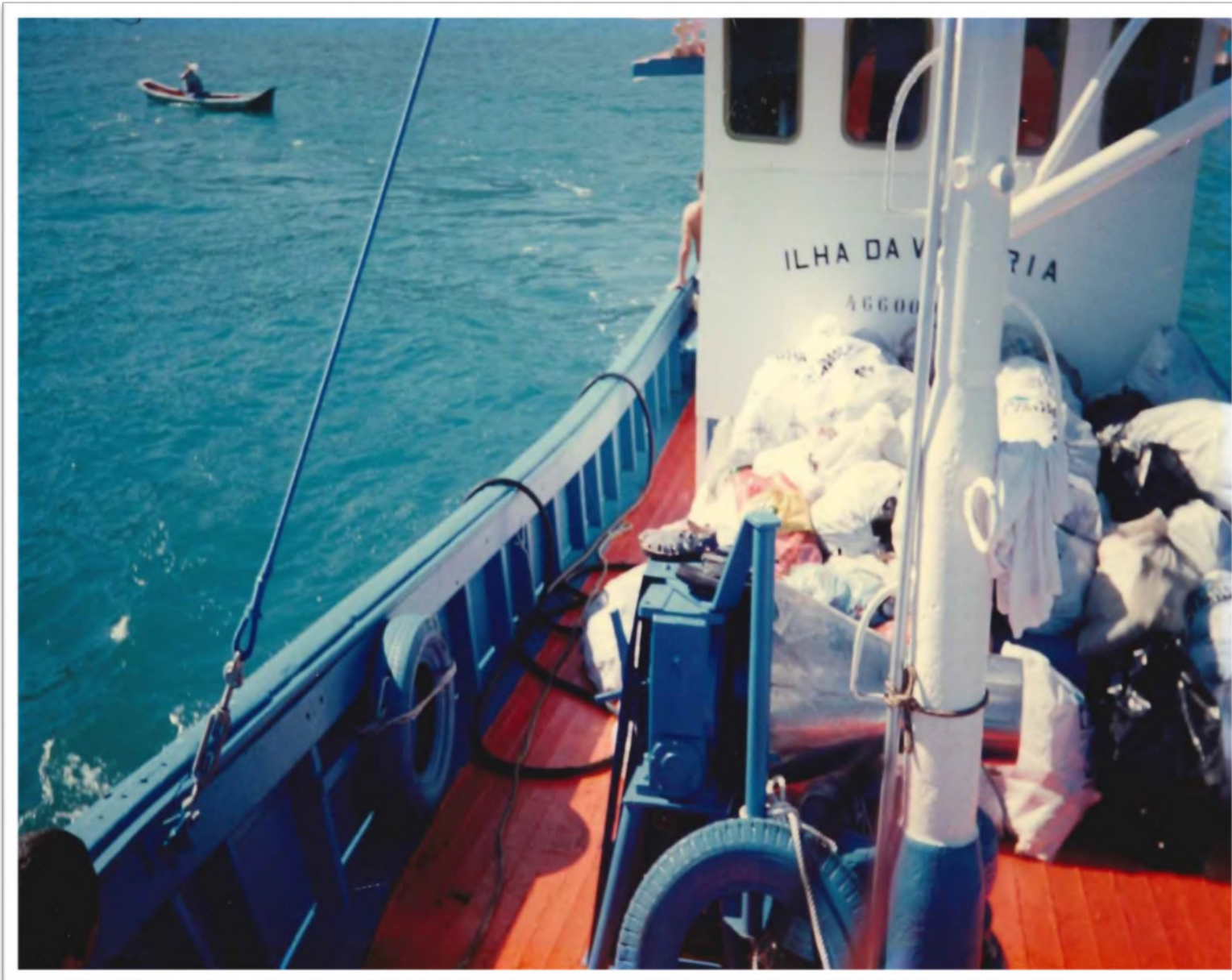
Barco Ilha da Vitória: distribuição de alimentos na região de Ilhabela. Déc. 1990