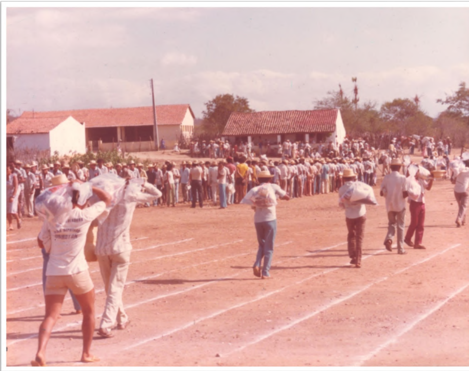
Missão Asa Branca: Alimentos para a região Nordeste. Déc. 1980