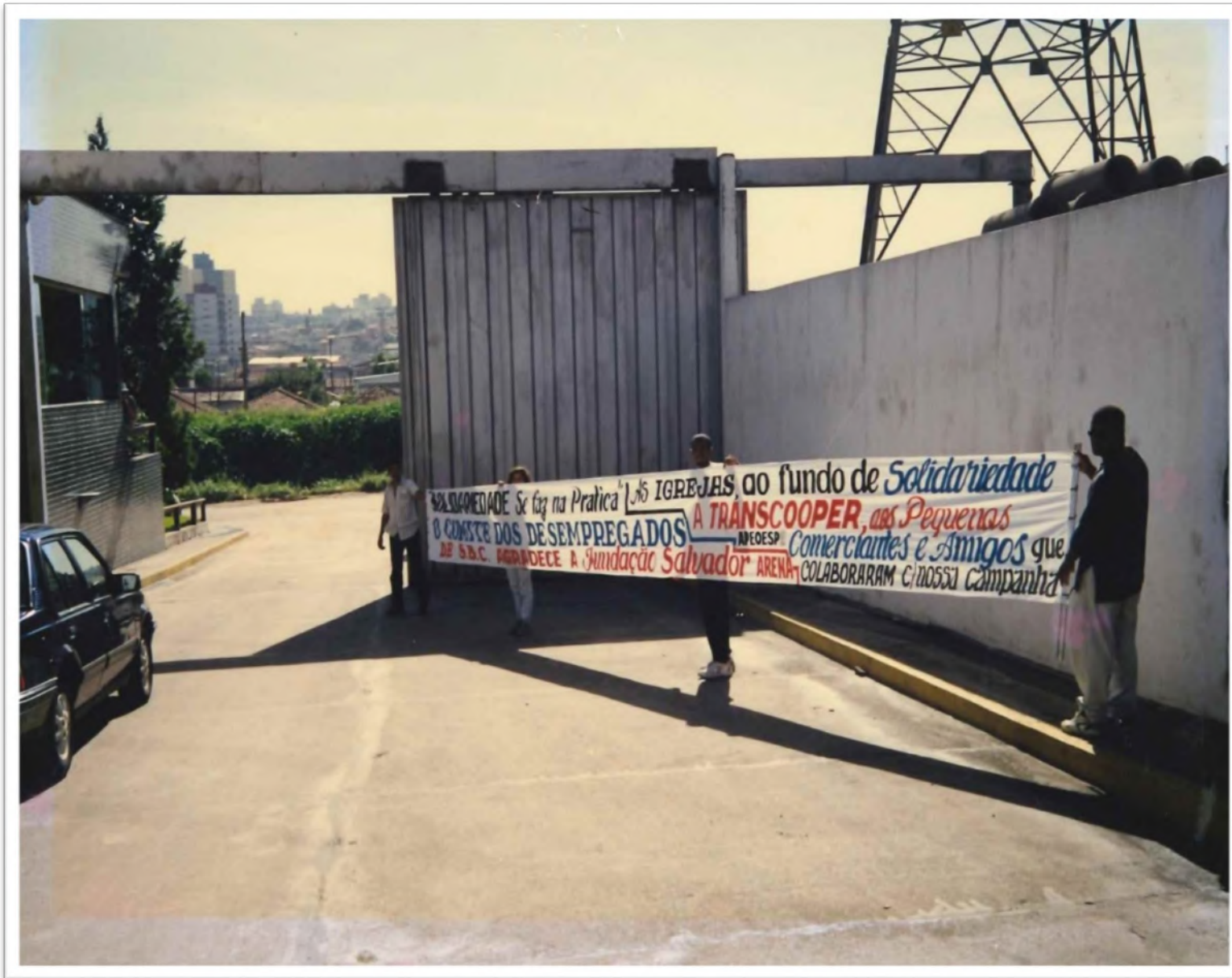
Faixa de agradecimento à Fundação Salvador Arena pelo programa “Adote um Desempregado”. Déc. 1990