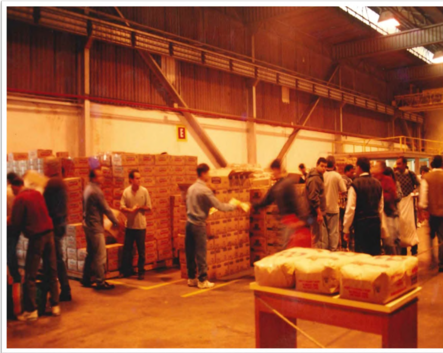
Programa “Adote um Desempregado”. Déc. 1990