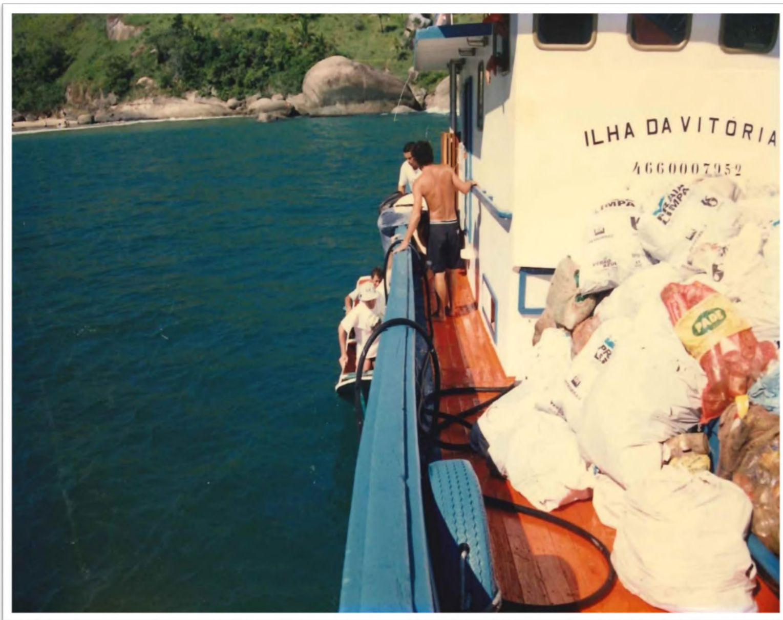
Barco Ilha da Vitória: distribuição de alimentos na região de Ilhabela. Déc. 1990