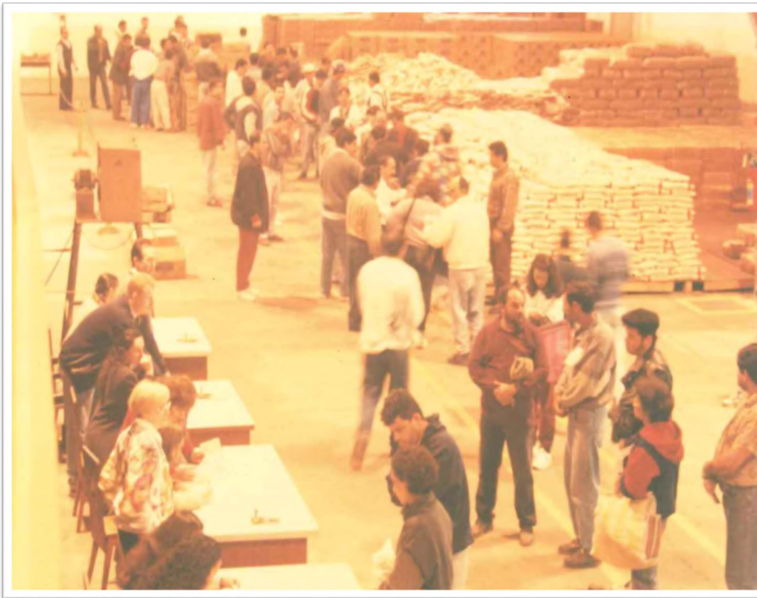
Programa “Adote um Desempregado”. Déc. 1990