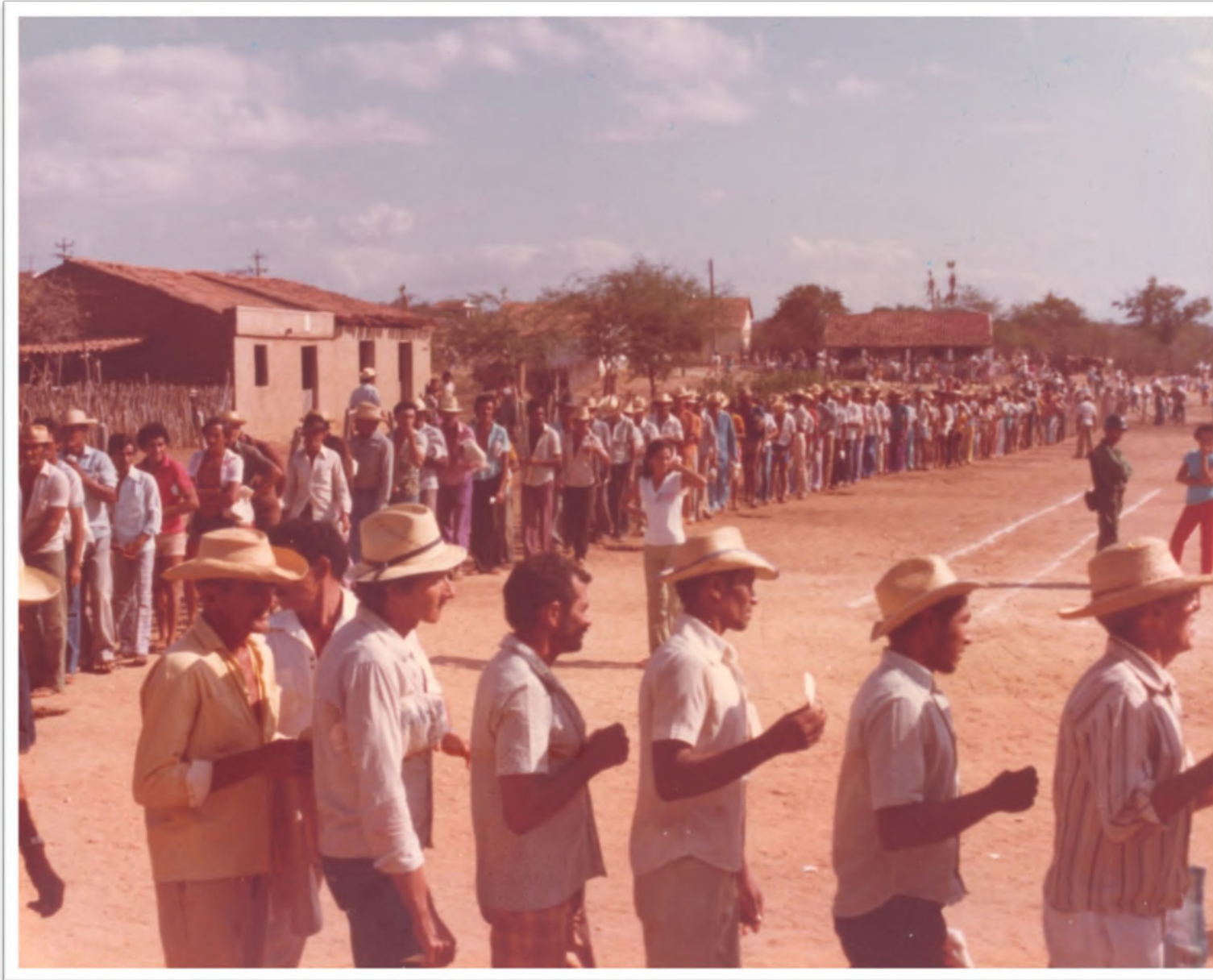
Missão Asa Branca: Alimentos para a região Nordeste. Déc. 1980