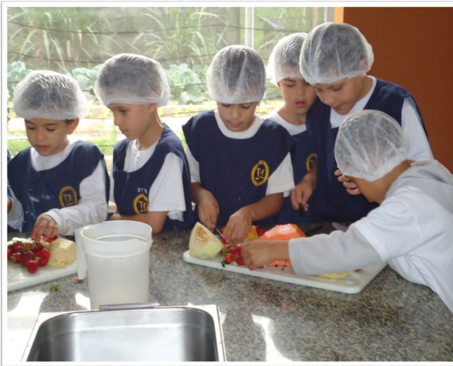
Alunos participando de oficina culinária. 2013