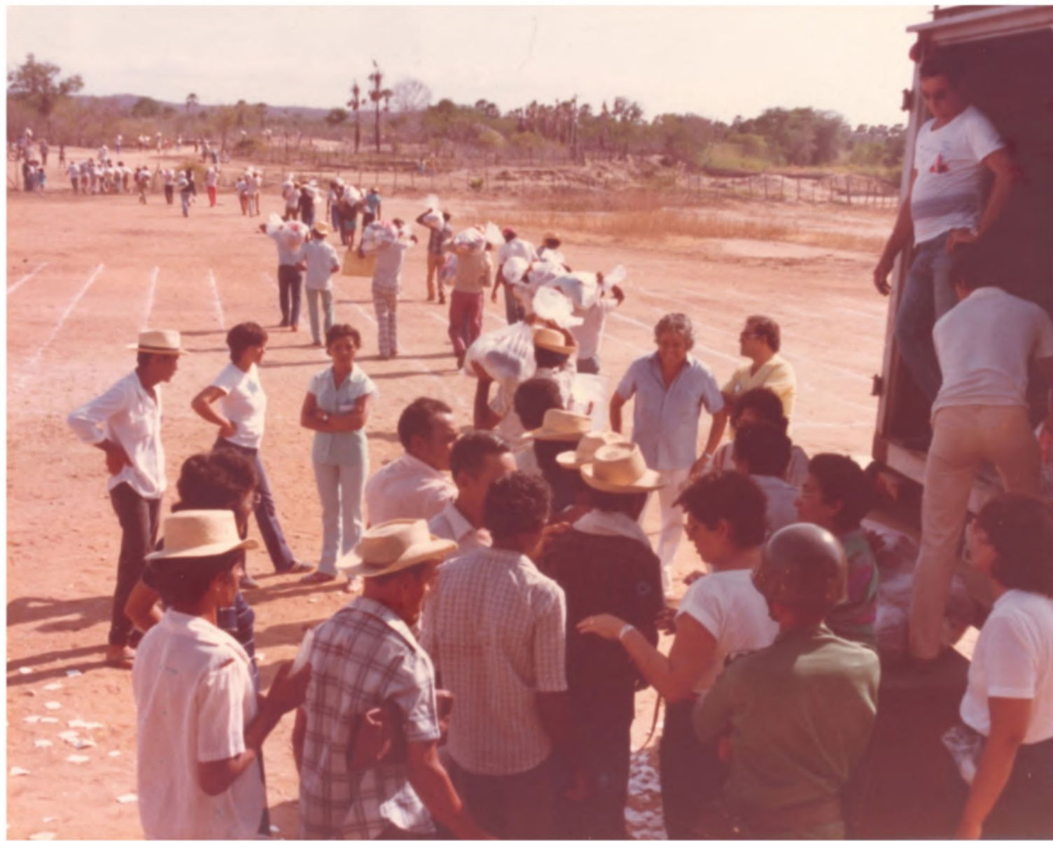
Missão Asa Branca: Alimentos para a região Nordeste. Déc. 1980