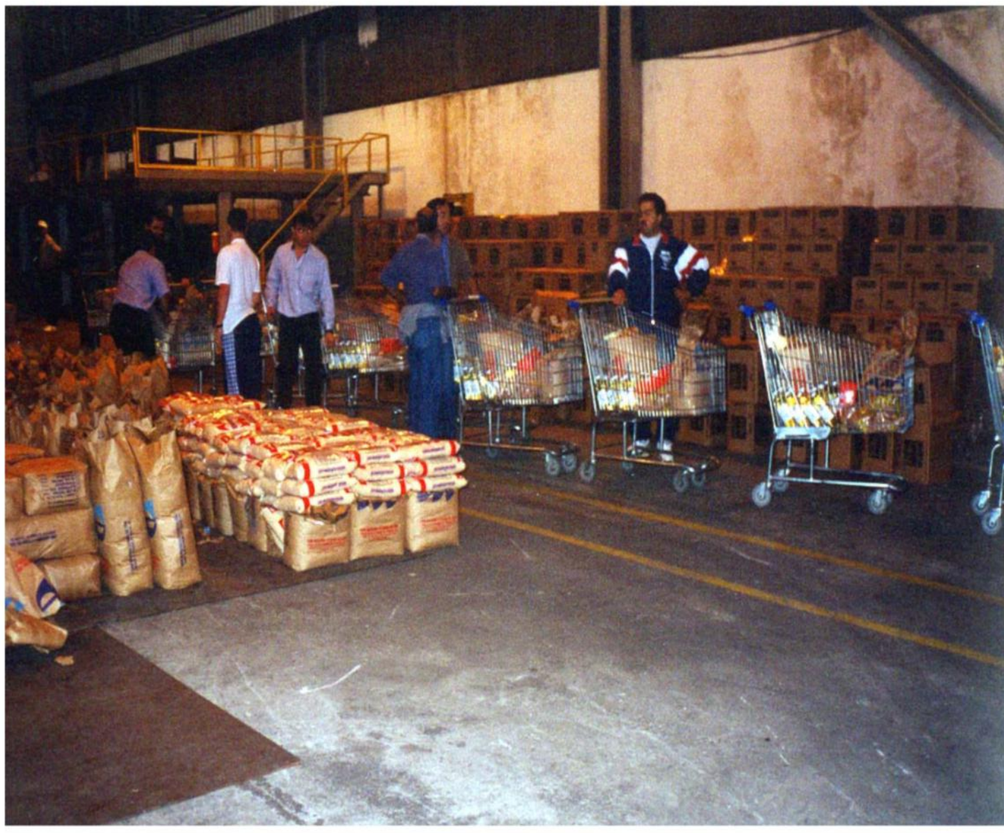
Programa “Adote um Desempregado”. Déc. 1990