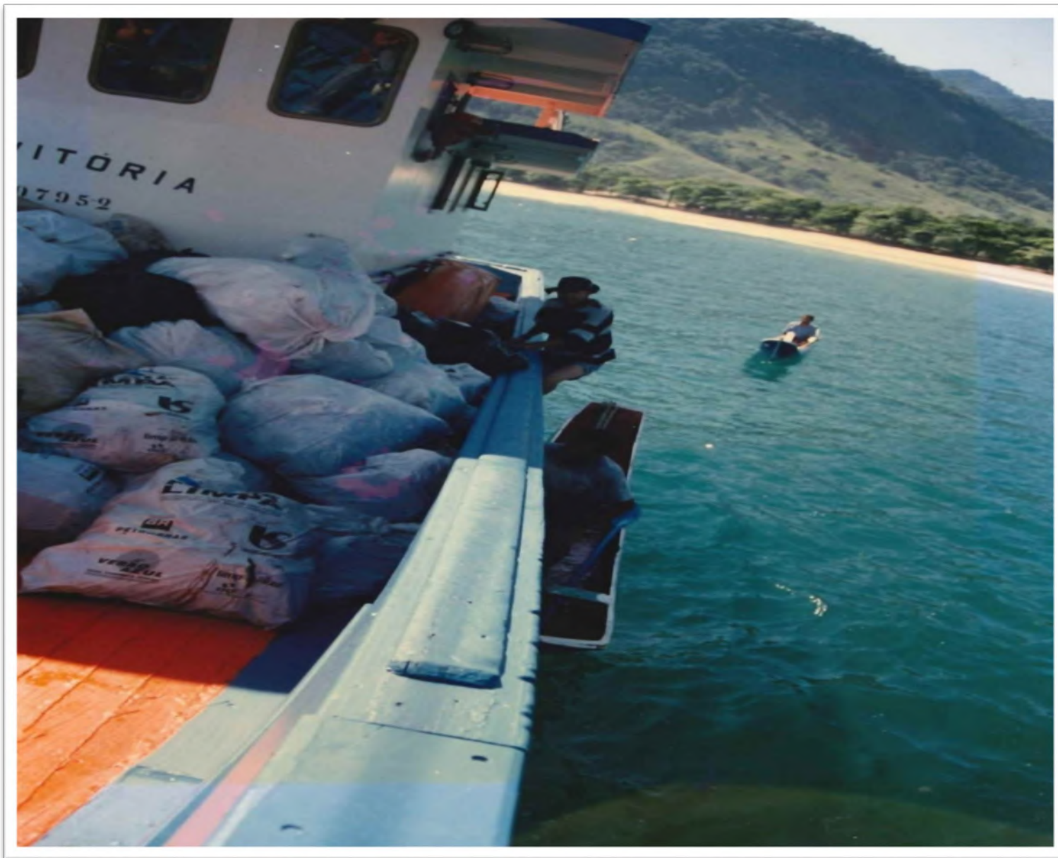
Barco Ilha da Vitória: distribuição de alimentos na região de Ilhabela. Déc. 1990