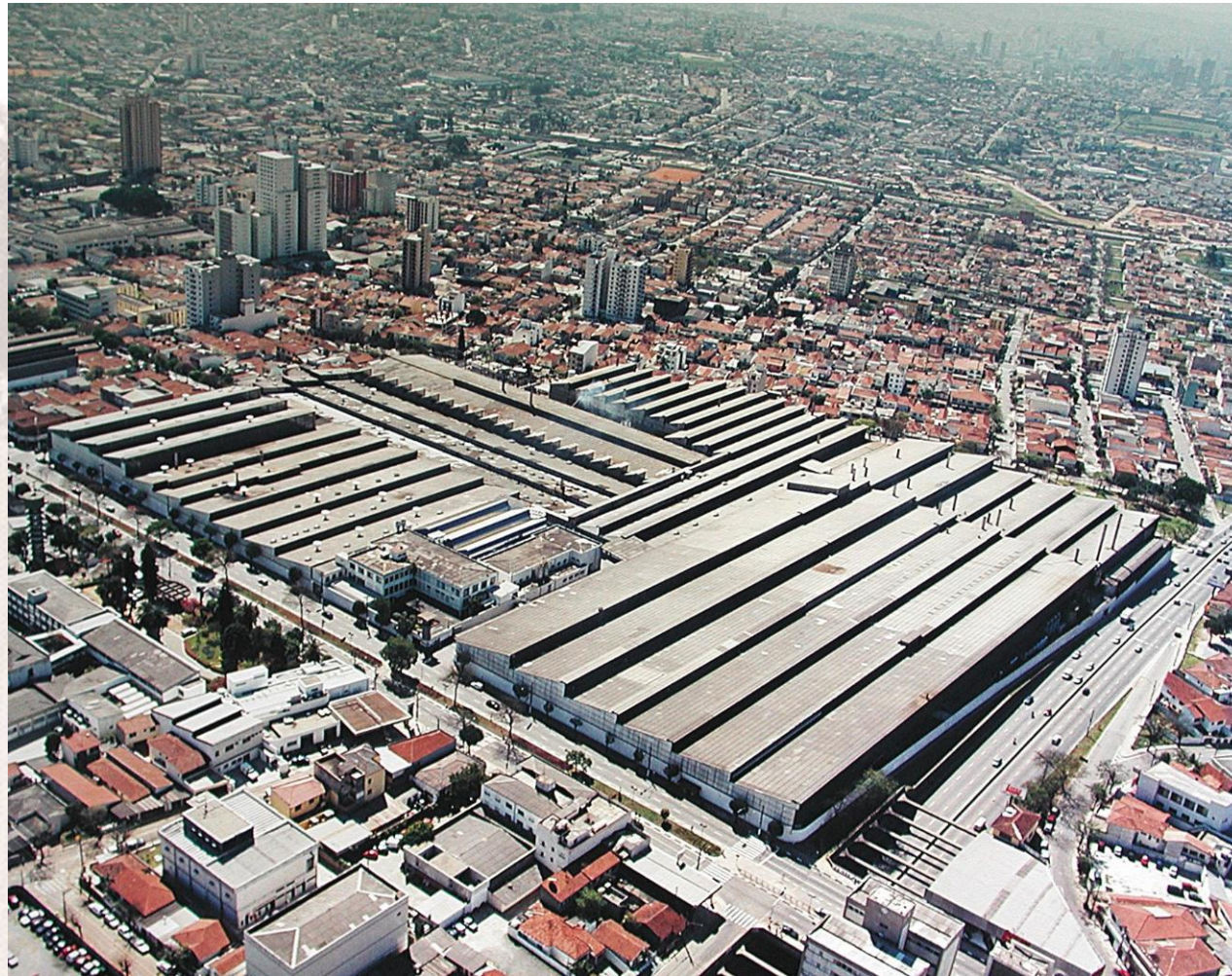
Termomecânica - Fábrica I . 2006

... é no início do século XX que ela começaria a ganhar as feições que apresenta hoje, como um grande polo industrial.