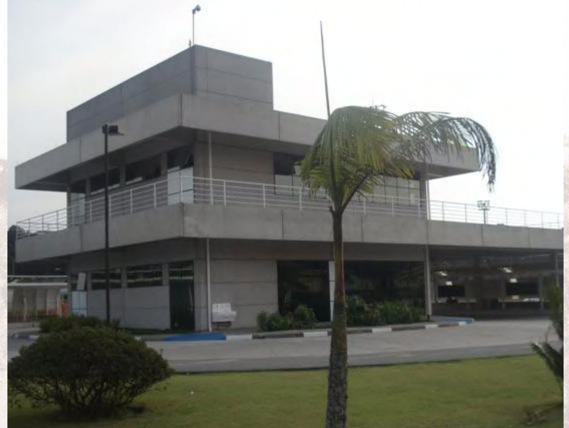
Portaria CEFSA. 2008