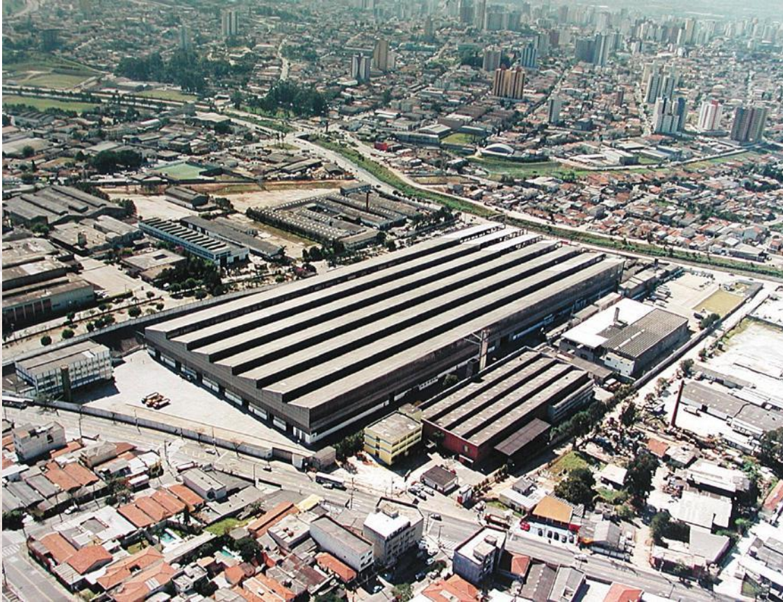
Termomecânica - Fábrica II. 2006

A Fundação Salvador Arena e São Bernardo do Campo continuam caminhando lado a lado, crescendo juntas.