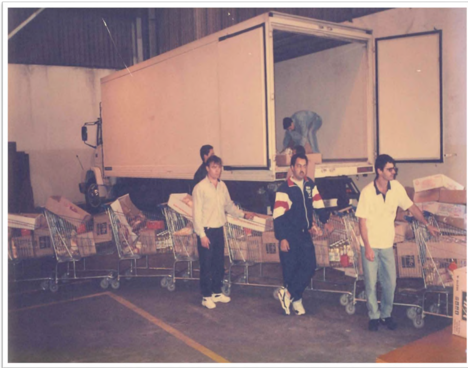
Programa “Adote um Desempregado”. Déc. 1990