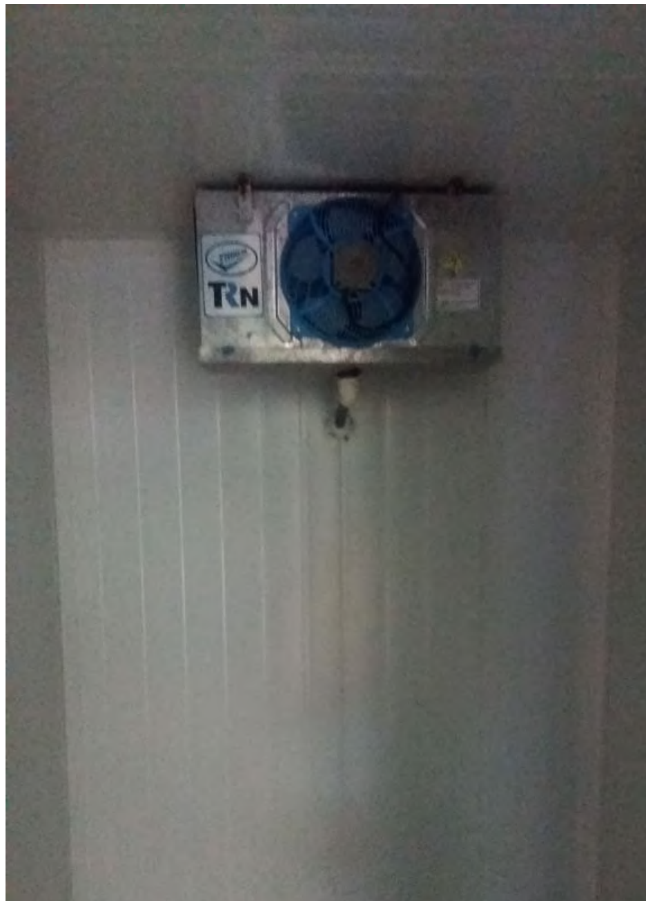
Câmara fria em funcionamento. 2020