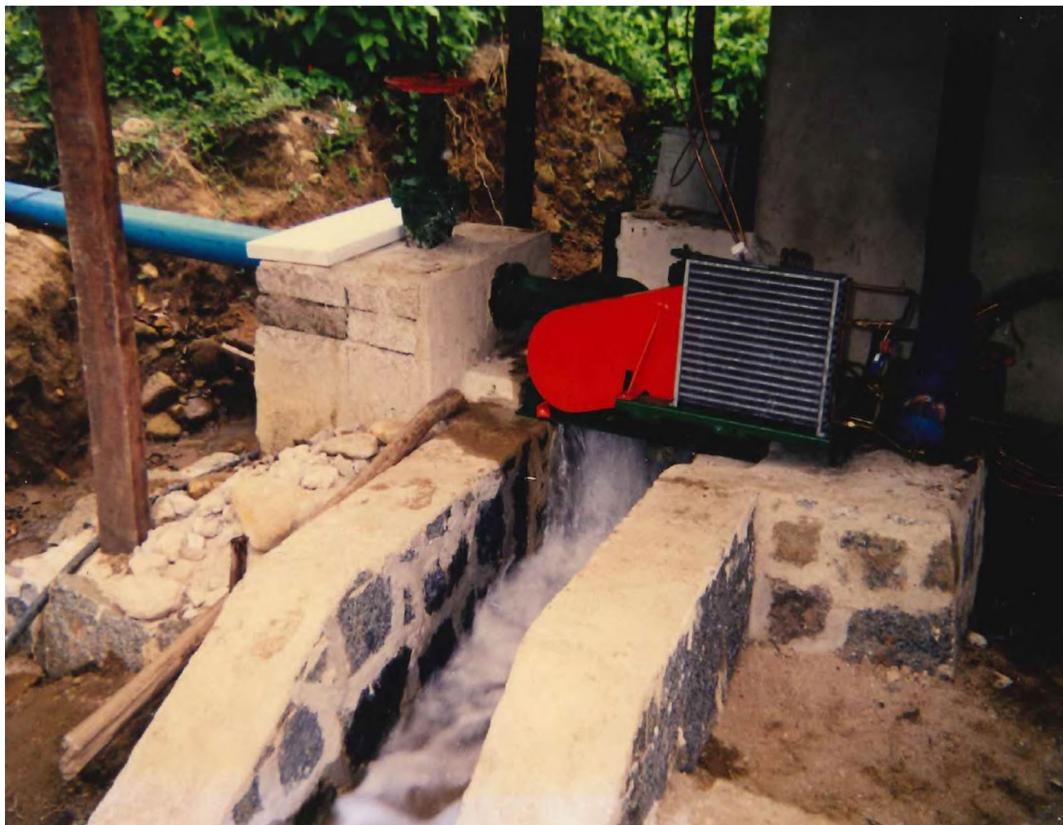
Construção da câmara fria.1997