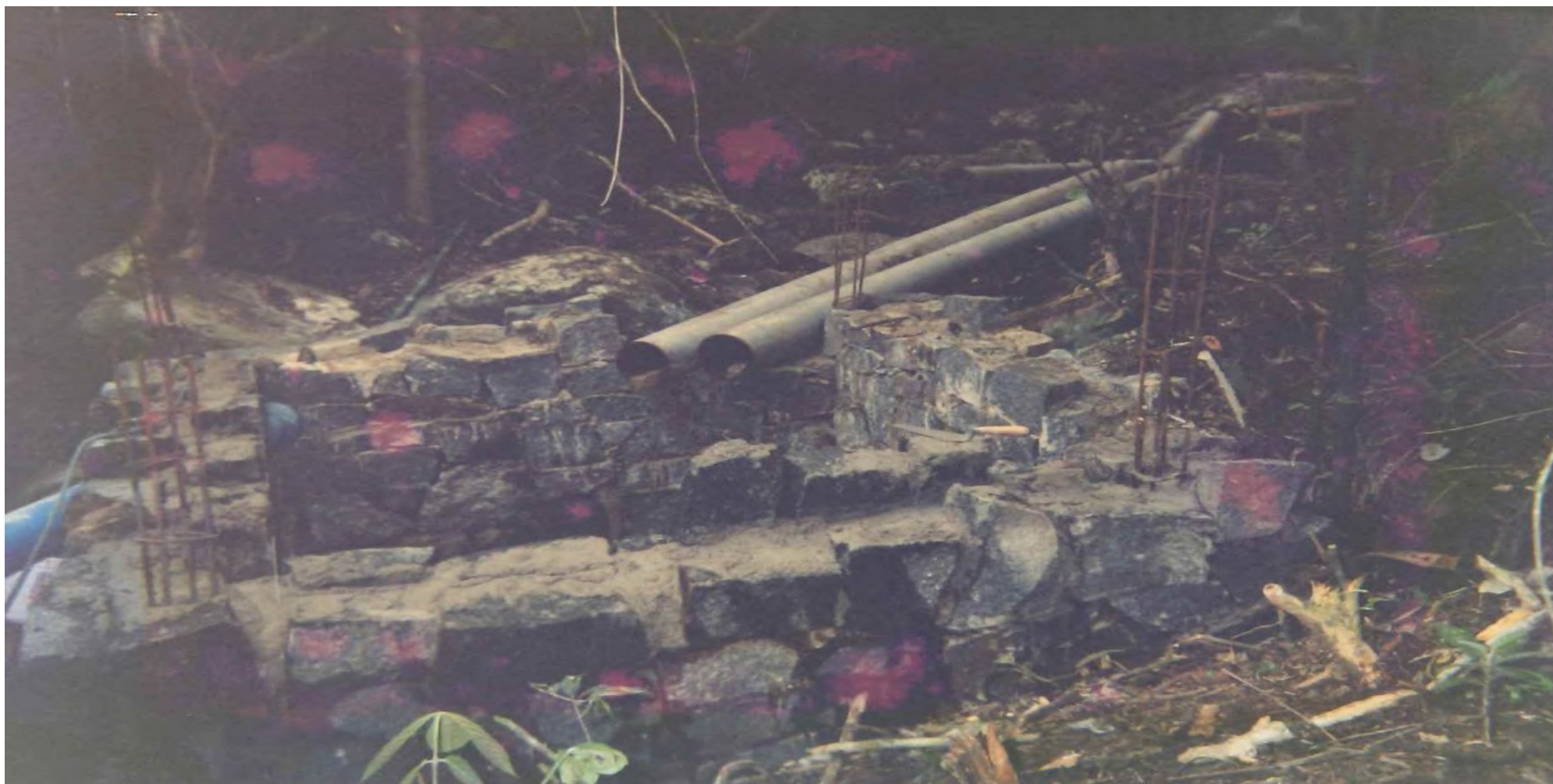
Construção da câmara fria na Praia Mansa. 1997