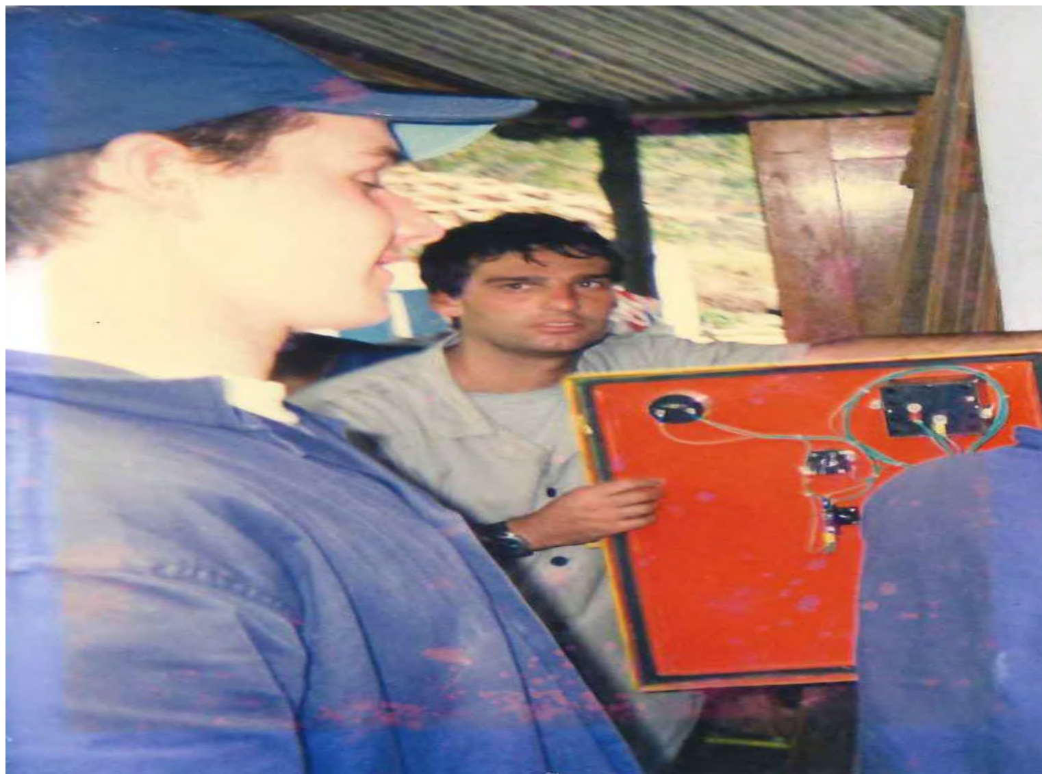
Painel de controle câmara fria. 1997