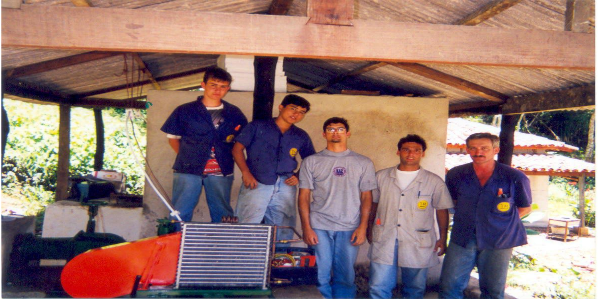
Alunos e professores TM na construção da câmara fria na Praia Mansa. 1997