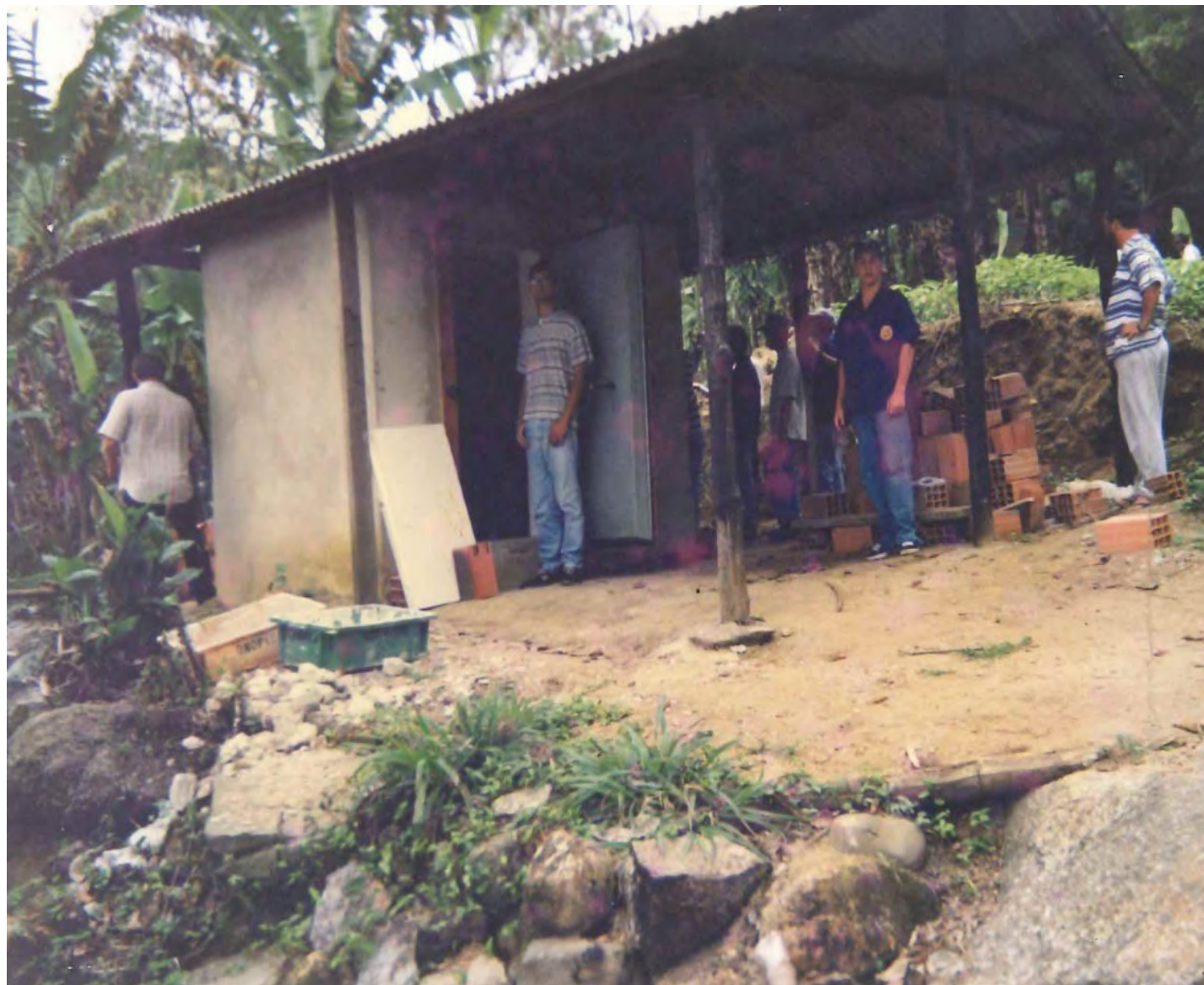
Construção da câmara fria na Praia Mansa. 1997

Em novembro de 1997, deu-se início à construção da câmara fria em Praia Mansa. Os envolvidos no projeto chegaram ao local utilizando o Barco Ilha da Vitória, o mesmo que fez parte de outra iniciativa da Fundação Salvador Arena em prol de comunidades caiçaras da região de Ilhabela.