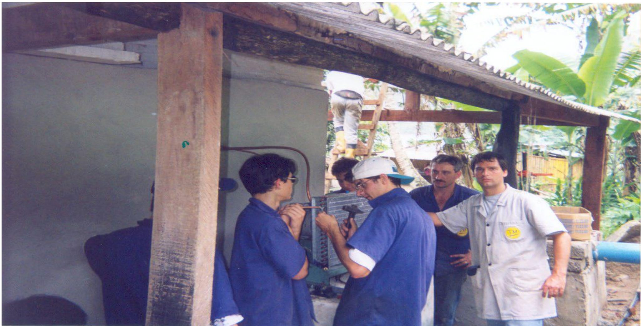
Alunos e professores TM na construção da câmara fria na Praia Mansa. 1997