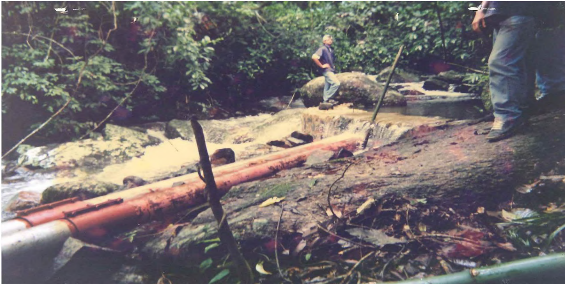
Construção da câmara fria na Praia Mansa. 1997