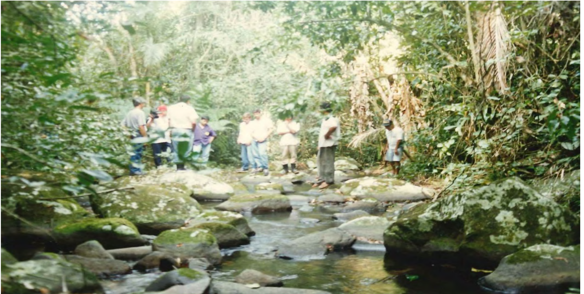
Construção da câmara fria na Praia Mansa. 1997