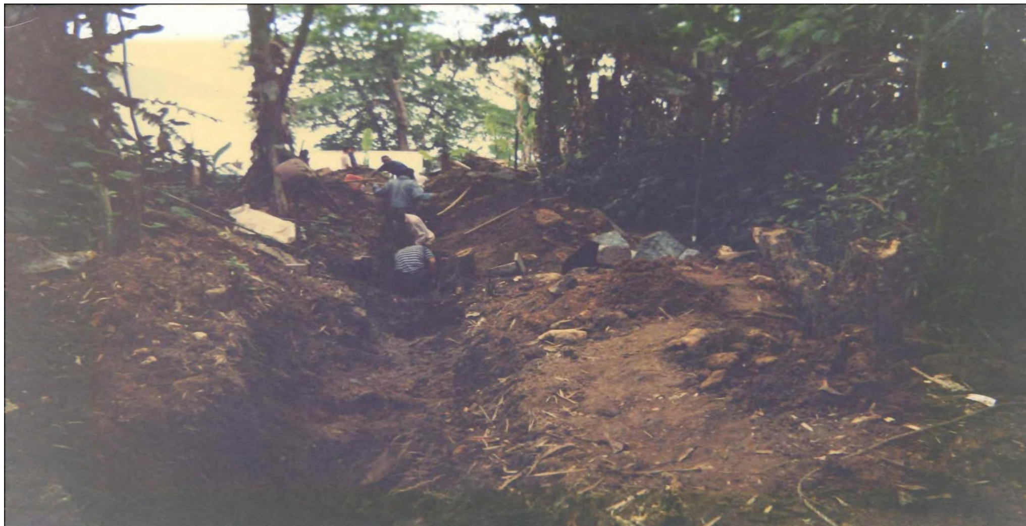
Construção da câmara fria na Praia Mansa. 1997