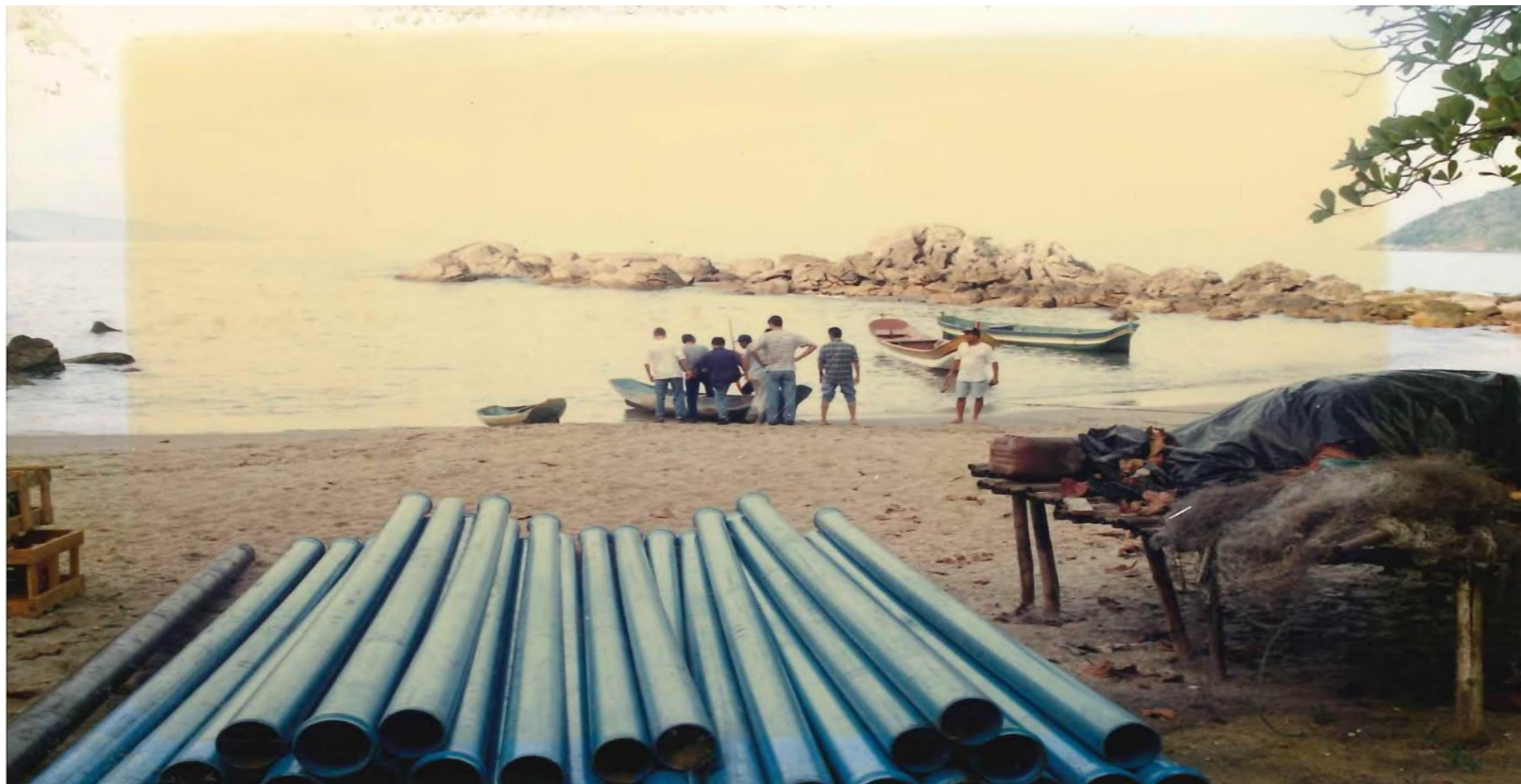
Tubulação para a construção da câmara fria. 1997