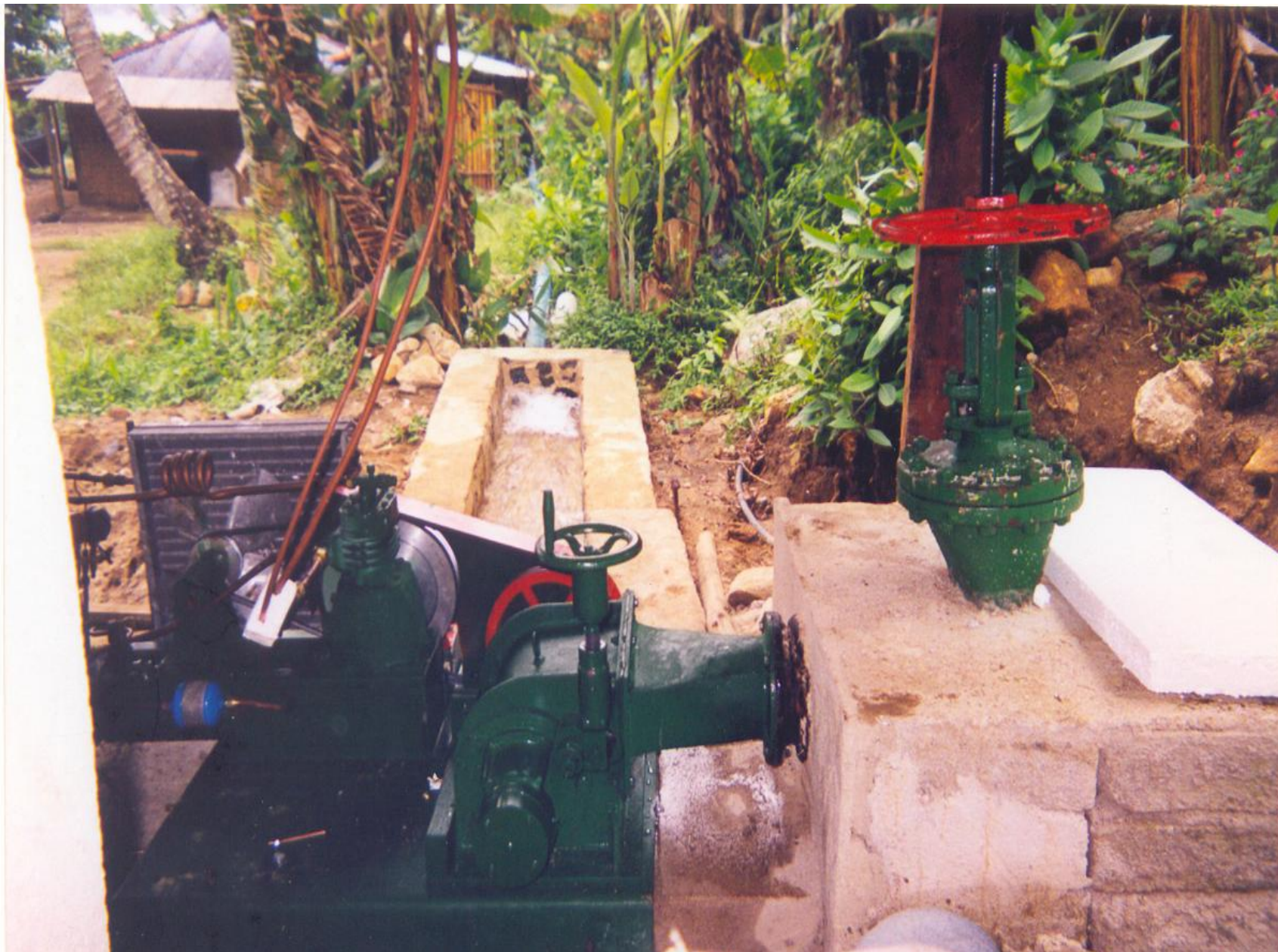
Construção da câmara fria na Praia Mansa. 1997