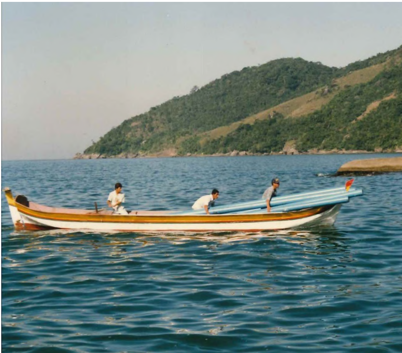
Desembarque dos materiais para a construção da câmara fria na Praia Mansa. 1997

Conhecido por suas belas praias, o município tem na pesca uma de suas principais atividades econômicas. Os pescadores, no entanto, não possuíam, na época, local adequado para armazenamento dos peixes.