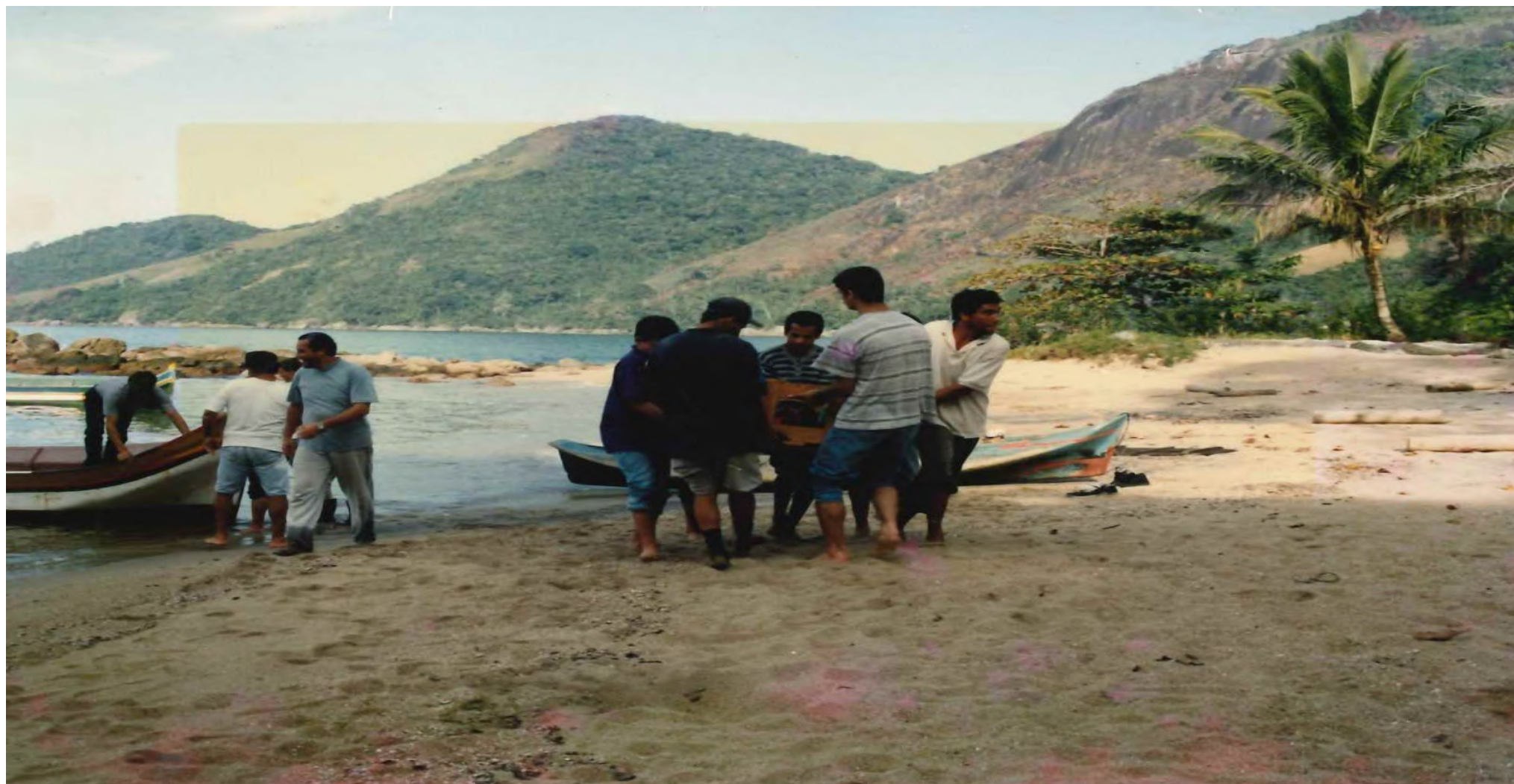
Desembarque dos materiais para a construção da câmara fria. 1997