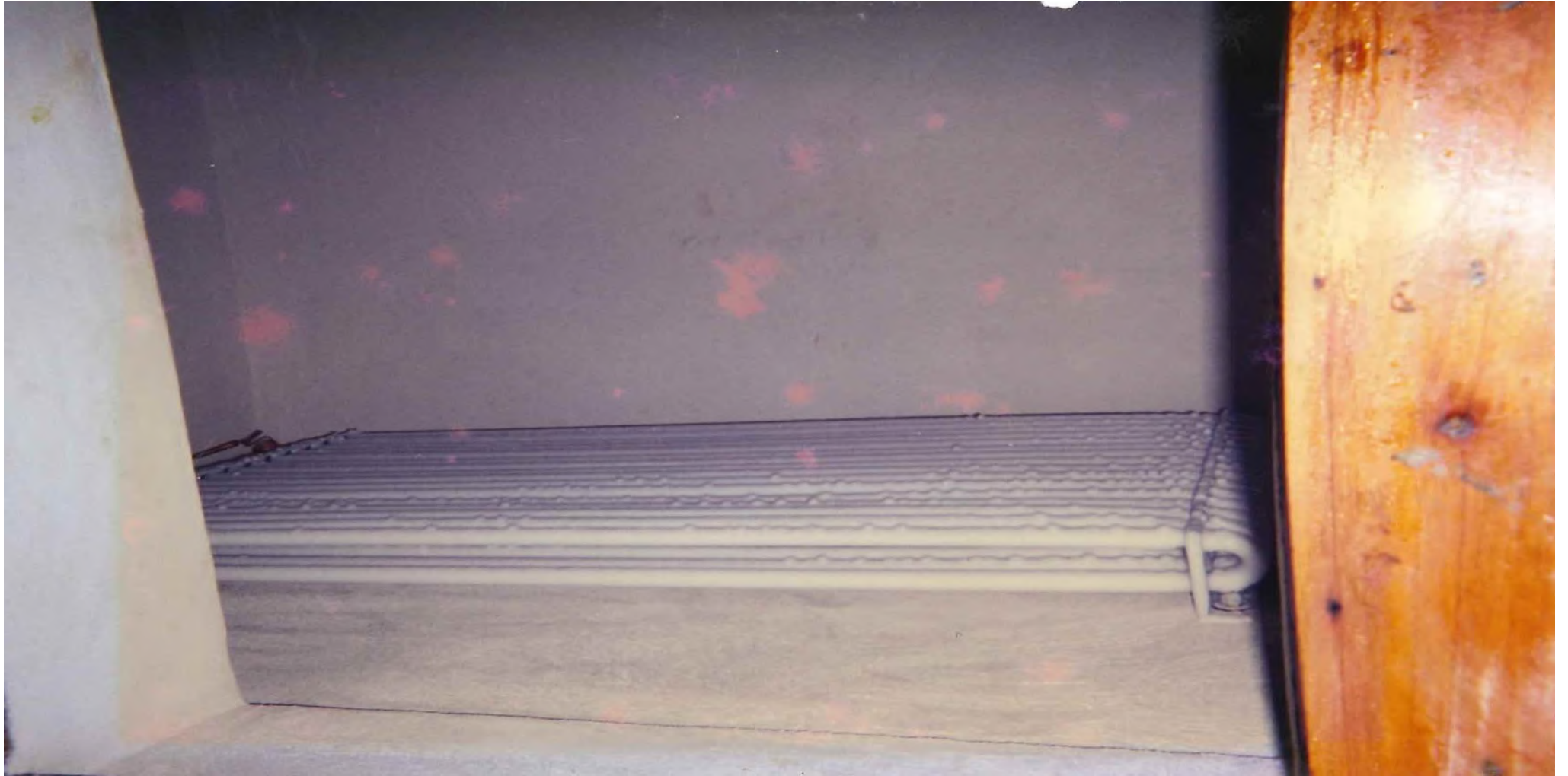
Câmara fria em funcionamento. 1997